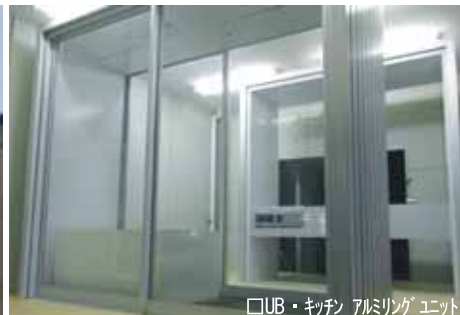
□UB・キッチン アルミリングユニット