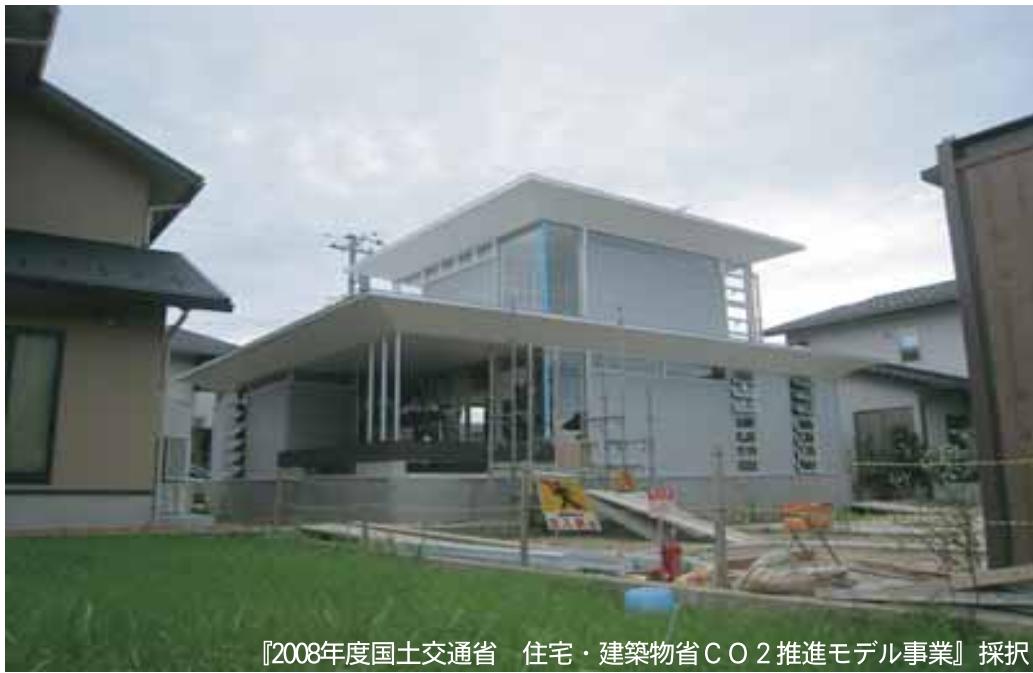
『2008年度国土交通省 住宅・建築物省CO2推進モデル事業』採択